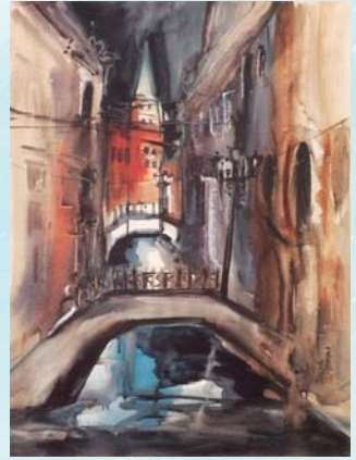
宜蘭縣美術學會 創會長 陳忠藏-威尼斯二重橋

感謝翁金珠主委、宜蘭縣美術學會、蘭陽美術學會、桃園市美術協會、台灣美術協會、台灣藝術大道促進協會、台南市新象畫會、新營美術學會、彰化縣美術協會、鍾敦浩畫室、吳哲叡、台灣粉彩畫協會、中華民國心齋藝術學會、新竹市百合扶輪社、新竹市宜蘭同鄉會以及新竹縣花藝協會等17個藝術團體，112位來自台灣各地的藝術家們；感謝各位的共襄盛舉！