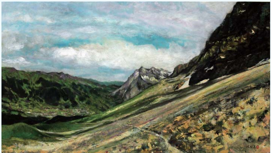
新竹市美術協會 榮譽理事長 林授昌-春之頌