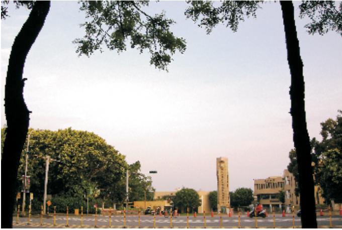
◀ 國立科學工業園區實驗高級中學

併入「國立科學工業園區實驗高級中學」。至於冷水坑溪上游與西側地區，則大部份為竹科管理局徵收為工業用地與科園、金山安遷戶社區。近年來光長、關埔計畫的開發、內灣線捷運新設「新莊站」，以及「好市多」大賣場設立，帶動此地區房地產的蓬勃發展，成為新竹市房屋仲介業的搶手地區。