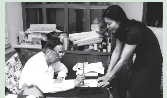
女兒田又方—父親的得力助手隨侍在側磨墨拉紙書僮