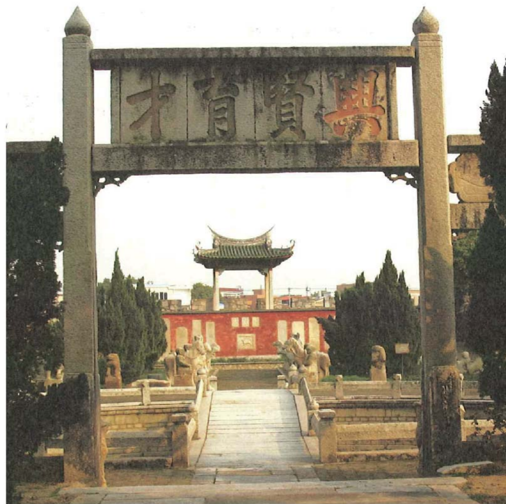
《同安孔廟的科舉坊》

台灣僅存的節孝祠，康熙元年通令各地設節孝祠於儒學內，祠門外建大坊一座，將前後節孝婦女，標題姓名於其上，已故者設位其中。