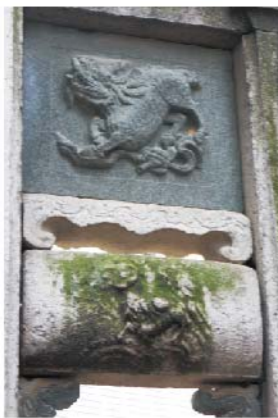
次間花板麒麟雕飾僅存於双旌節孝坊

清代最後的牌坊，聖旨牌「節孝」題文，石柱聯語在文革時均被泥土沙灰覆蓋，無法得知內容，不幸中反而保護這些內容不受損壞。比照2008年楊氏坊(現已拆除)清理後原有文字圖案均再出現即為一例。牌坊上依稀可見「毛○○萬歲」「共○○萬歲」的革命口號，是文革時代對「封資修」最「革命」的批判。