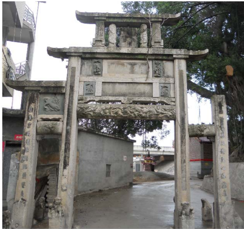
廈門大學國學研究院 周雪香提供