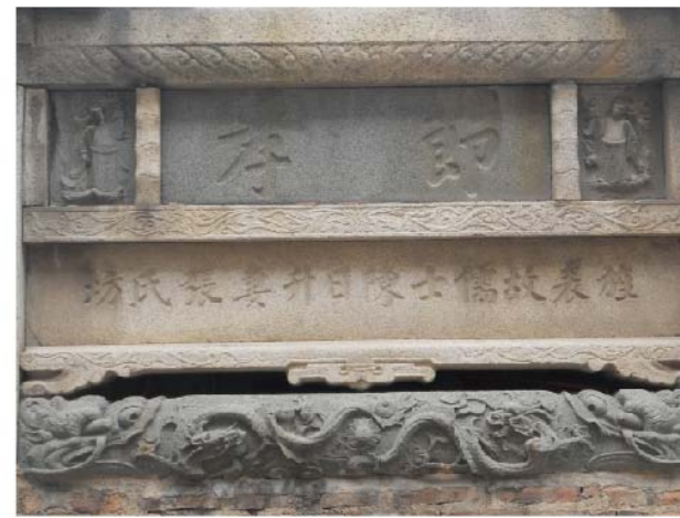
明間枋額的龍首箍頭雙龍搶珠深浮雕

明間橫刻雕刻雙龍中，尚有魚躍禹門的故事，明間的「乳姑不怠」，次間的「蘇武牧羊」保存良好。「節孝」匾的兩側，陰刻旌表過程參與的職官銜題名，成為閩南地區通則。