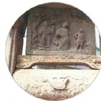
深浮雕的蘇武牧羊與神龜洛書(下)