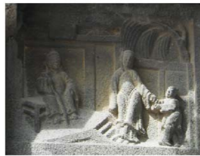
深浮雕的乳姑不怠