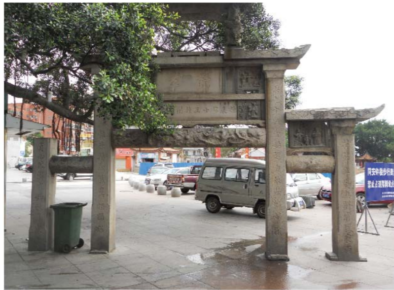
陳氏節孝坊（陰面）廈門大學國學研究院 周雪香提供

牌坊的聯句，題聯均用楷體書法，成為研究書法，書家的真實材料，石雕中聖旨牌匾用鏤空雕法，其餘多為浮雕，透雕較為少見，最醒目的明間橫額在龍首簷頭內雕雙龍（陽面）雙鳳（陰面）或兩面皆為雙龍圖飾，次間橫額則以祥龜、龍馬、雲鶴、喜鵲為常見素材，亦有以銅錢、芭蕉代替鶴鵲。明間或次間青斗石花板浮刻有歷史人物故事，並無定制，回首麒麟較少出現必備的天官加冠進祿浮雕較多，間亦有透雕。