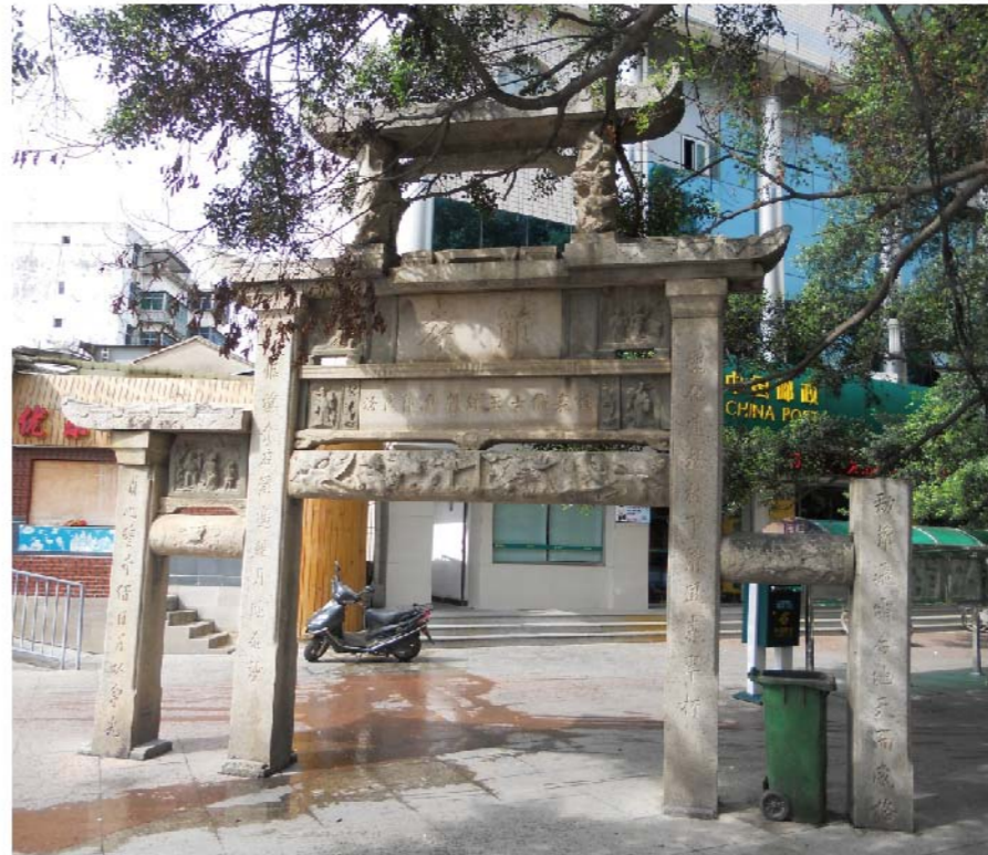
陳氏節孝坊（陽面）