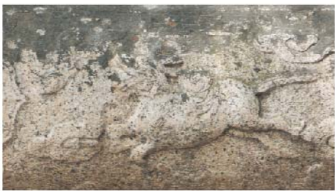
同安牌坊的龍馬河圖