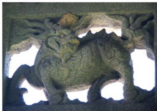
新竹李錫金孝子坊