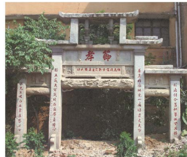
《2008年大力從灰泥中整修，2012消失的鄭文貞妻楊氏坊》