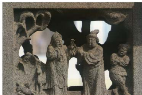
金門許氏坊右側人物胡人形象較明顯