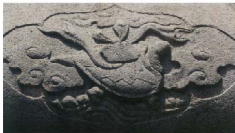
金門牌坊的神龜洛書