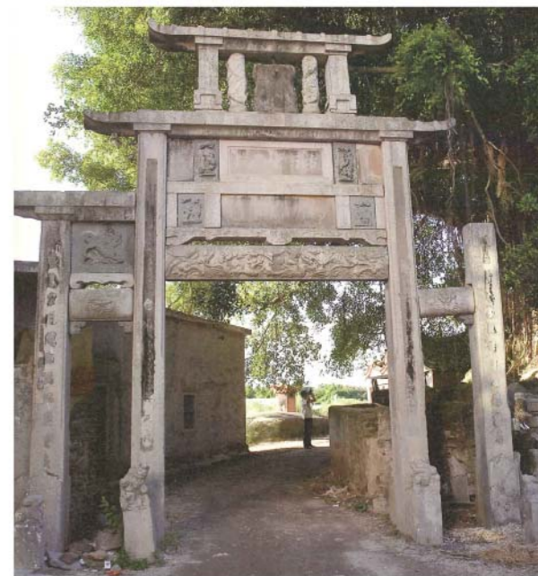
《灰泥掩盖的雙旌節孝牌坊》