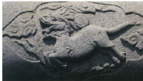
金門牌坊的龍馬河圖