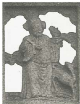
金門邱良功母節孝坊