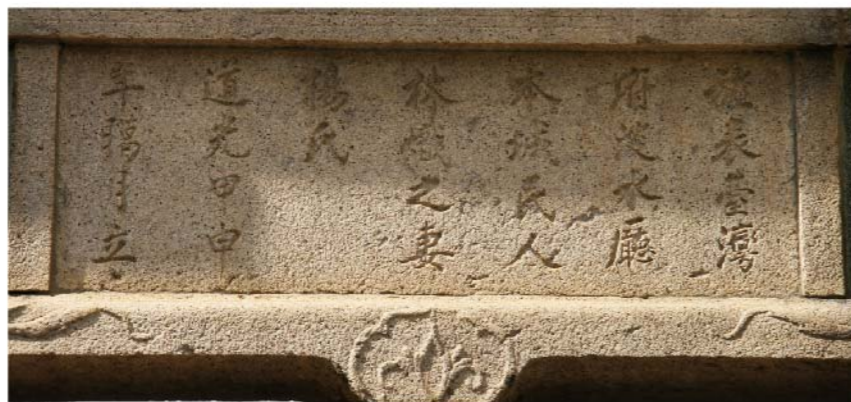
《楊氏節孝坊的事蹟坊》