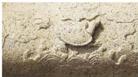
同安牌坊的神龜洛書