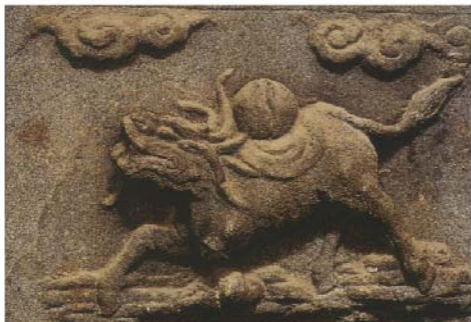
新竹牌坊的龍馬河圖