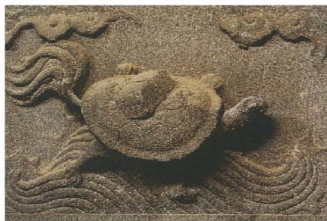
新竹牌坊的神龜洛書