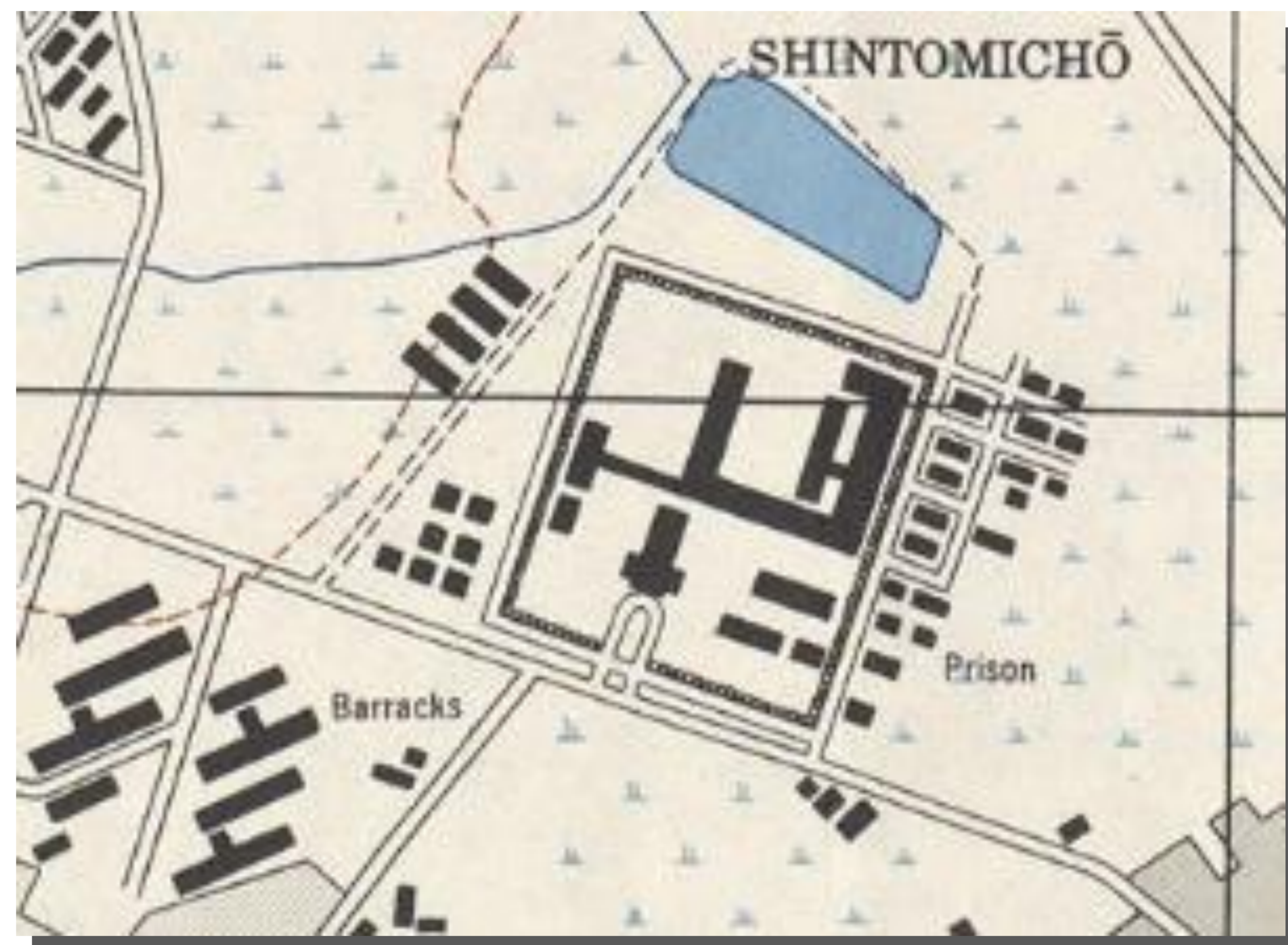
昭和20（1945）年美軍繪製的「臺灣城市地圖」

現存官舍包括五種不同位階，有高二種、丙種二戶建、丁種二戶建、丁種四戶建及獨身宿舍，為現今僅存「基地紋理」與「建物類型」均保存完整的重要案例。